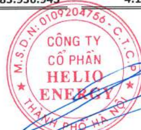
Phan Thành Đạt Chủ tịch Hội đồng quản trị