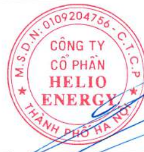
Phan Thành Đạt Chủ tịch Hội đồng quản trị