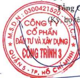
Trần Quốc Đoàn